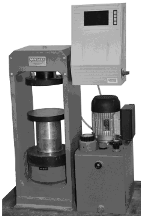
Rys. 11.1. Prasa hydrauliczna do badania wytrzymałości na ściskanie.

Próbkę do badania należy ustawić współosiowo ze środkiem przegubu płyty dociskowej, tak aby zapewnione było jej stabilne położenie. Nie należy stosować żadnych materiałów przekładkowych. Można położyć cztery odcinki stalowej taśmy tej samej szerokości co powierzchnia ścianki zewnętrznej i 50 mm od niej dłuższe, dwa na wierzchu i dwa u podstawy, wyrównując je na każdym końcu, w przypadku: