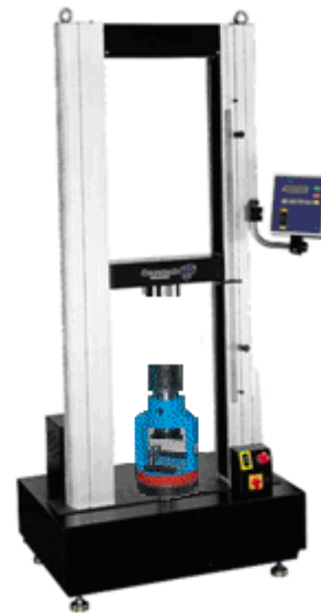
Rys. 6.2. Uniwersalna maszyna wytrzymałościowa na zginanie.

gdzie: b – długość boczna przekroju beleczki, mm; F_f – obciążenie łamiące na środku beleczki, N; l – odległość między podporami, mm.