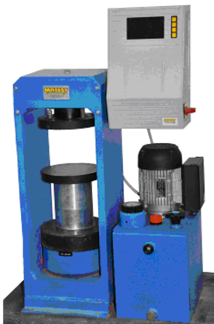
Rys. 6.3. Prasa hydrauliczna do badania wytrzymałości na ściskanie.

Badanie wytrzymałości na ściskanie przeprowadza się na połówkach beleczek. Połówki te otrzymuje się w wyniku wcześniej przeprowadzonego oznaczania wytrzymałości na zginanie lub przez przepołowienie beleczek w taki sposób, aby nie została naruszona ich struktura.