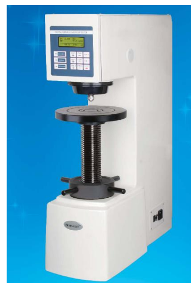
Rys. 9.2. Twardościomierz Brinella.